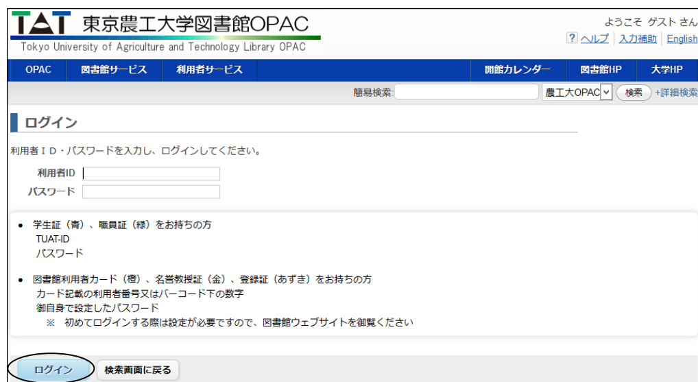
図 1-3 MyOPAC ログイン画面