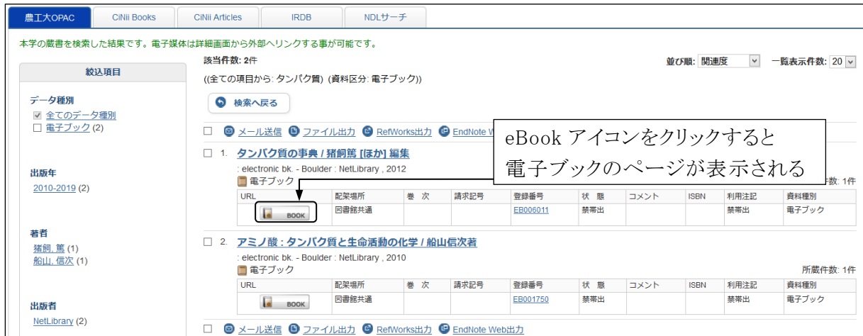
図 2-5 電子ブックの検索結果一覧画面

現在、Springer Link、Wiley Online Library オンラインブックス、Elsevier(Science Direct)、EBSCOhost Research Databases、KinoDen の電子ブックが農工大 OPAC から検索できます。