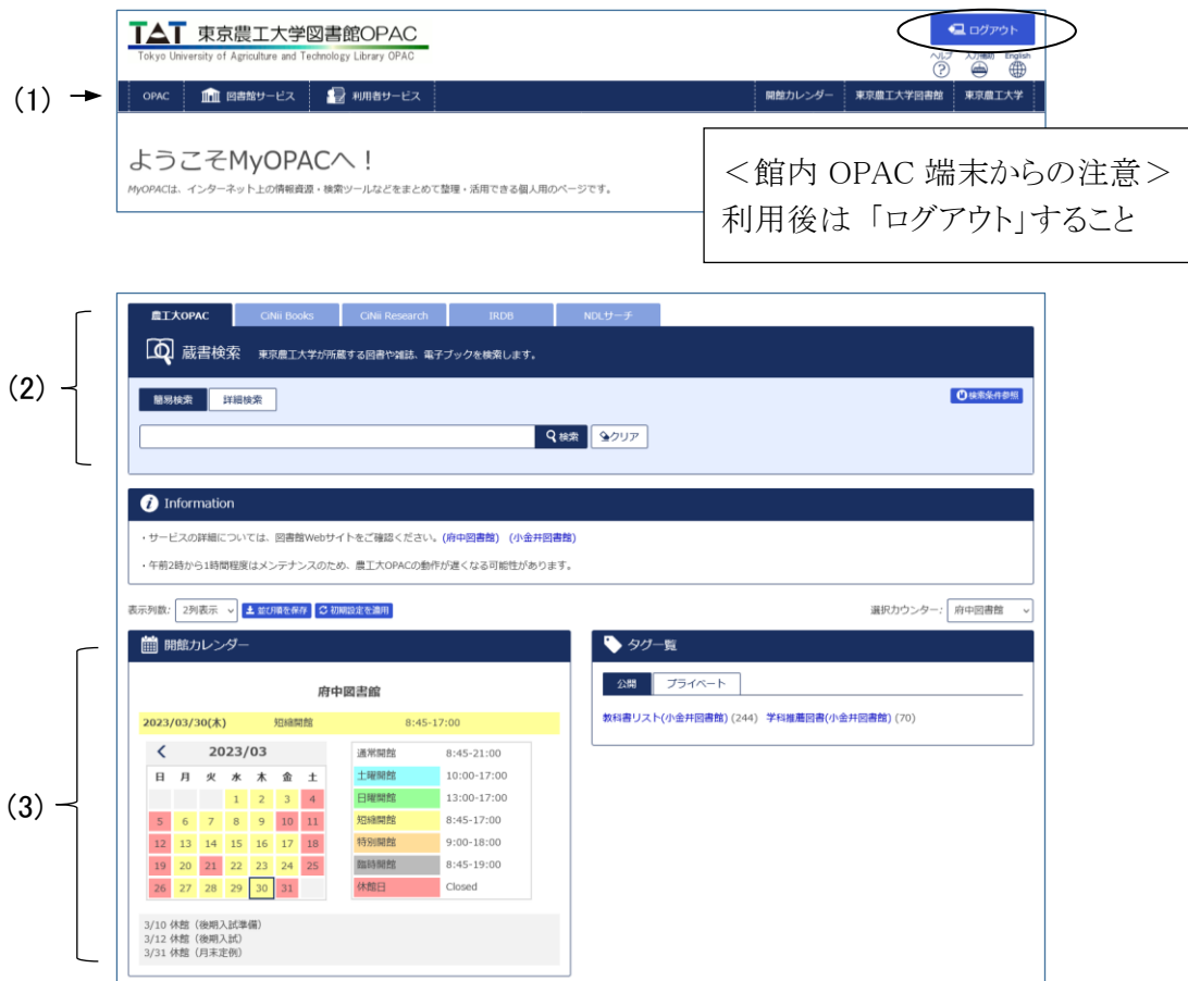
図 1-4 MyOPAC メニュー画面