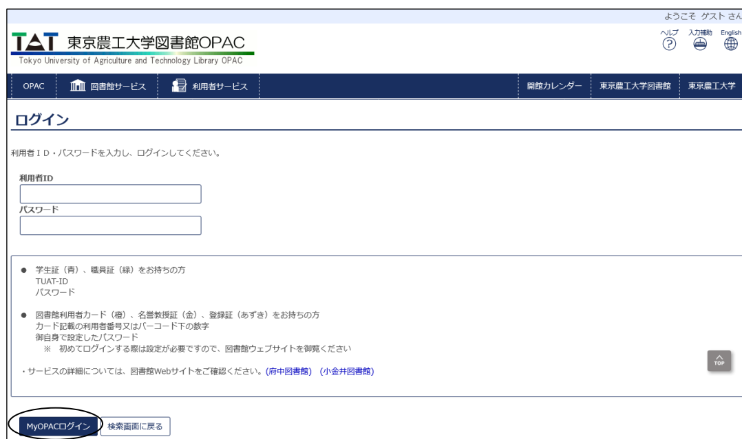
図 1-3 MyOPAC ログイン画面